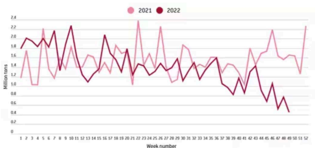
图 3 2021 与 2022 年欧洲向俄罗斯每周进口原油数量 24

在大力强化能源合作的背景下，美国对欧洲能源供应迅速增加。俄乌冲突爆发前，俄罗斯占欧盟天然气需求的 40%以上，但到 2023 年已降至 12%左右，美国成为这一供应缺口的主要填补者。2023 年 4 月，美欧能源安全工作组发布进展报告称，美国对欧盟的液化天然气出口量增加了一倍多，已向欧盟额外输送 150 亿立方米天然气，占欧盟天然气进口总量的 52%以上，已成为欧盟最大的液化天然气进口来源方 22 。另据英国《金融时报》报道，美欧计划到 2030 年每年向欧洲运送 500 亿立方米液化天然气 23 。原油出口方面，俄乌冲突爆发后，美国 2022 年对欧洲的原油出口量达到每日 175 万桶，比 2021 年的水平增长约 70%。2023 年 3 月，美国对欧洲的原油出口量达到每日 210 万桶，创下历史最高记录。与此形成对比的是，欧洲从俄罗斯进口原油的数量大幅下降（参见图 3）。